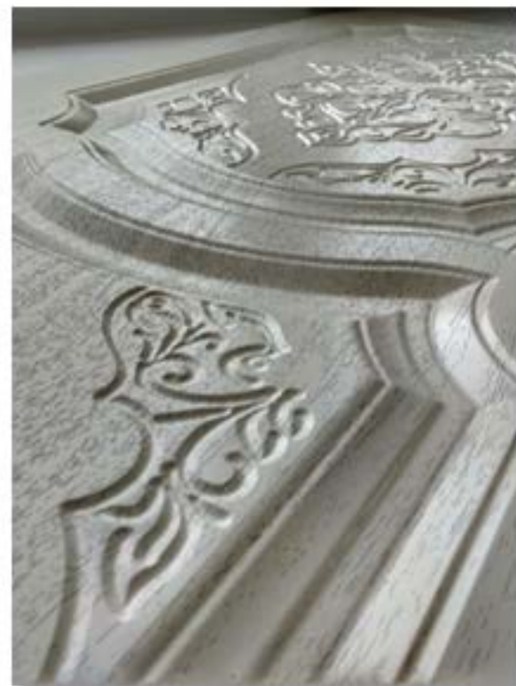
Дверные накладки различной сложности