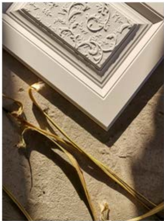
Фасады в консервативном стиле

На сегодняшний день, ориентируясь на вкусы клиента при выборе мебели, продуктовая линейка включает в себя: